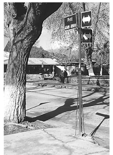
Plaza de Olmué.

Finalmente, manifestó que es necesario unir a la gente que trabaja en la actividad turísticas de Olmué.